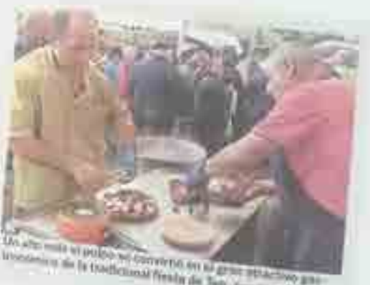
Un año más el pulpo se convirtió en la gran estrella gastronómica de la tradicional fiesta de San Juan.