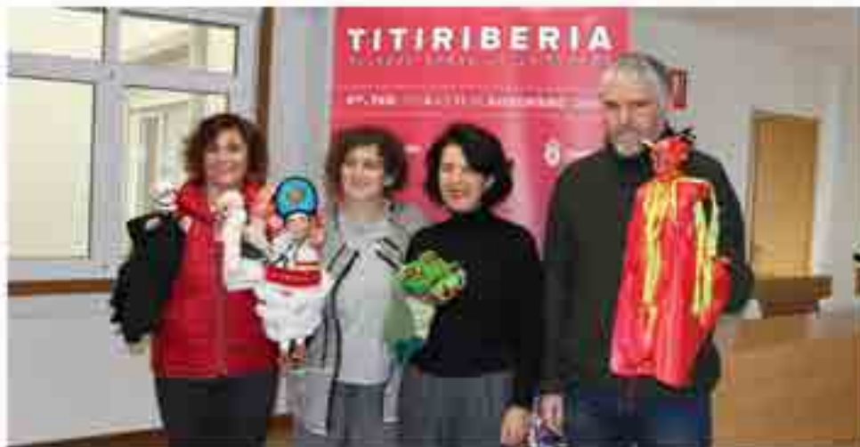
La Voz de Galicia

Setá do 11 ao 14 de novembro, en Teo, con acceso libre