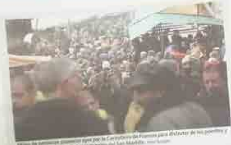
Miles de personas acudieron este sábado a la celebración de la Fiesta de Interés Turístico de Silleda, organizada por el Concello de Silleda.

Esperan que sea el último año sin la declaración de Fiesta de Interés Turístico // Los pañuelos amarillos contra la planta de residuos y el pulpo fueron protagonistas