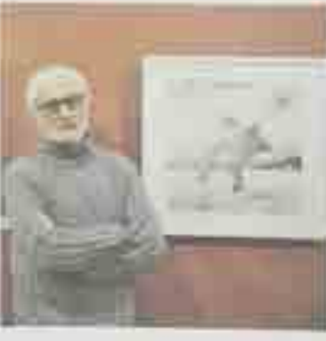
Exposición de Santiago...