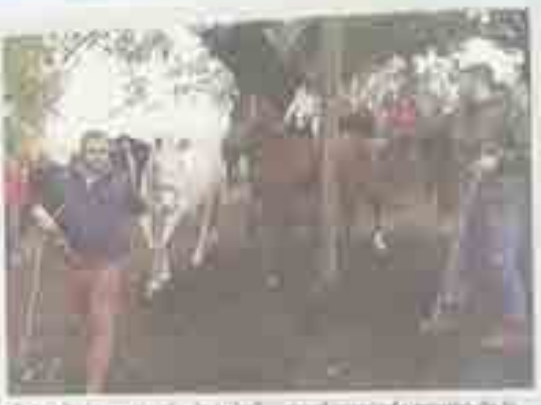
Esta año la procesión de cabalos en el mercado municipal de Silleda fue bastante menor que en otros años.

El día sábado de esta semana, que es el día de la celebración de la Fiesta de Interés Turístico de Silleda, organizada por el Concello de Silleda, se celebró la Fiesta de Interés Turístico de Silleda. El día sábado de esta semana, que es el día de la celebración de la Fiesta de Interés Turístico de Silleda, organizada por el Concello de Silleda, se celebró la Fiesta de Interés Turístico de Silleda.