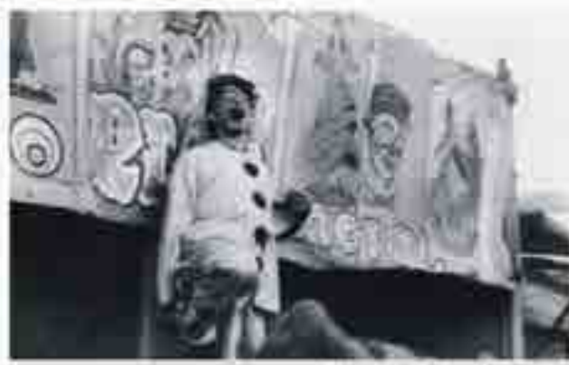
Representación de Berloga Verde.

O Títeres de Cachiporra, festival de títeres de cachiporra do Clave de Cachiporra, chegou na súa terceira edición unha dasa de novembro. Desde as 14 e 17 de novembro.