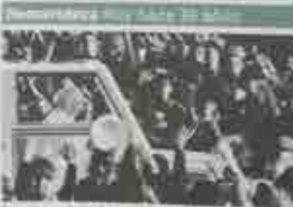
El papa Juan Pablo II oficia la misa del peregrino en Lavacolla.

Regresa el Outono Códax y se celebra en el Auditorio el Festival de Requinta da Ulla. Este festival musical celebra la música tradicional gallega y ofrece un espacio para la interpretación de canciones clásicas y modernas. El festival incluye conciertos en vivo y actividades culturales que celebran la herencia musical de Galicia. El Outono Códax es un evento destacado que atrae a un gran número de visitantes. El Festival de Requinta da Ulla es una excelente oportunidad para disfrutar de la música gallega en un entorno excepcional.