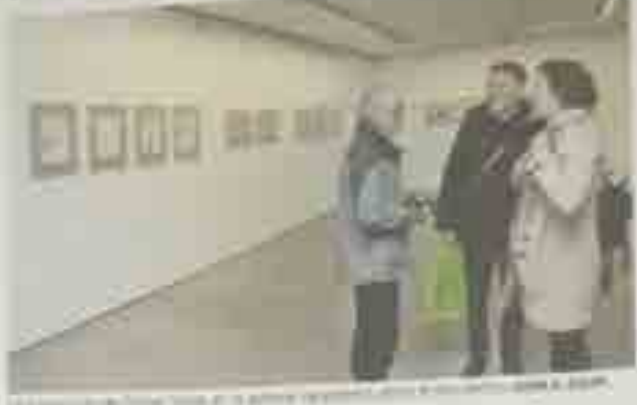
Exposición de fotos sobre el Camino de Santiago en el Parlamento del estado.