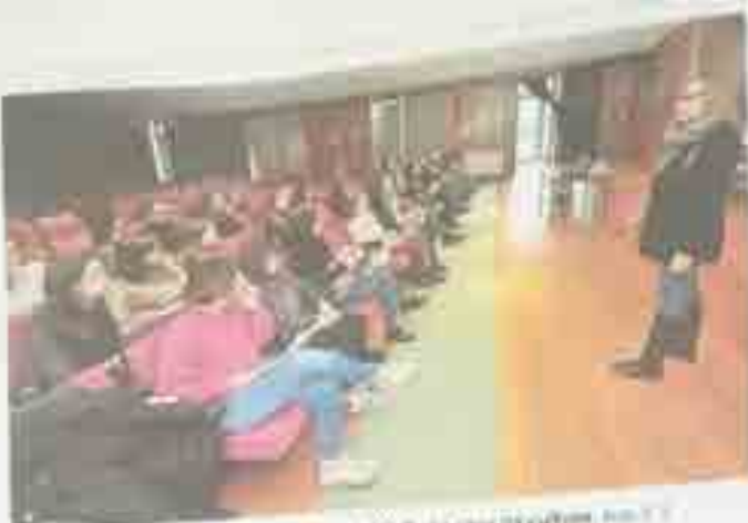
Un momento do curso de formación para pais e nais do Concello de Silleda, este sábado.

Unha vez máis, a disciplina positiva interesa a xoves e maiores de Silleda. O curso de formación para pais e nais, organizado polo Concello de Silleda, comezou este sábado, 15 de outubro, no salón de actos do Centro Cultural de Silleda. O curso, que se desenvolverá durante tres semanas, é organizado polo Concello de Silleda e conta coa colaboración do Concello de Silleda e do Concello de Silleda. O curso é organizado polo Concello de Silleda e conta coa colaboración do Concello de Silleda e do Concello de Silleda.